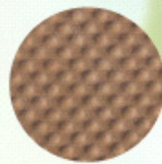
エンボス加工を施した普及タイプ

※ 特殊強化フィルムで厚紙をサンドイッチした「普及タイプ」もございます。普及タイプにはエンボス加工が施され、クッション性を確保。フロアのキズを防ぎます(写真下参照)。